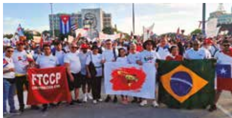
Encuentro de FLEMACON: Cuba, mayo 2025.