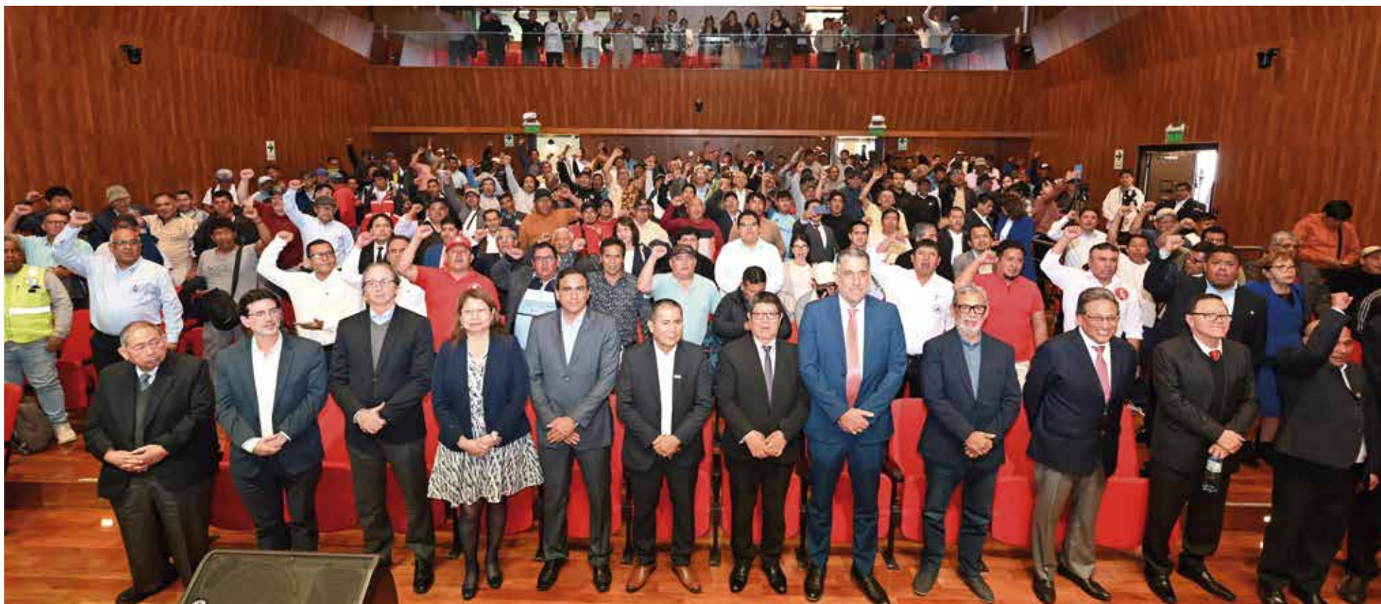
Trabajadores, empresarios y Gobierno en ceremonia celebrada por la FTCCP el 23 de octubre en su auditorio Mario Huamán Rivera.