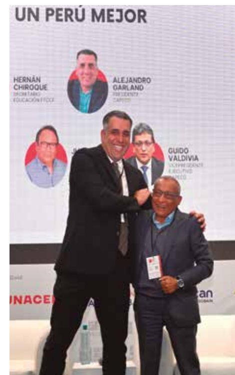
Capeco y FTCCP realizaron el foro.