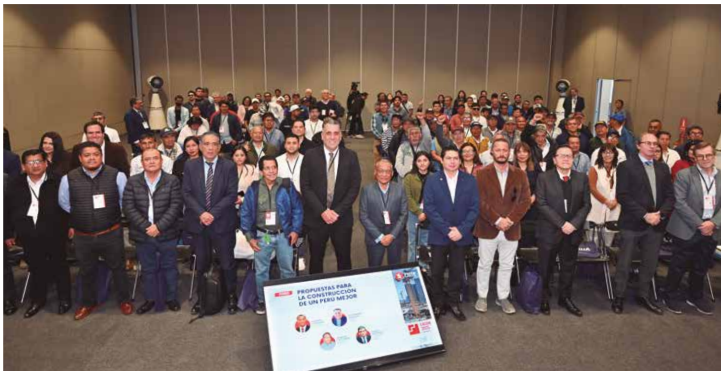
Trabajadores y empresarios en el foro "Propuestas para la construcción de un Perú mejor", el 9 de octubre, en EXCON 2025.