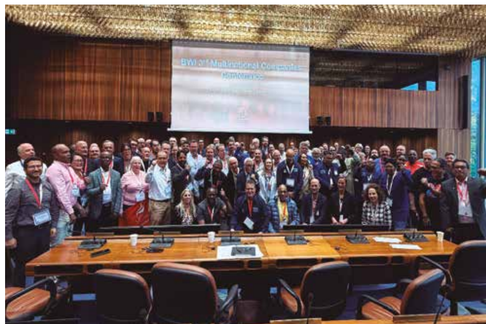
Conferencia de la ICM acordó con la FIFA seguridad y salud en obras deportivas.

La FTCCP participó en la III Conferencia Mundial de Empresas Multinacionales de la ICM, destacando la experiencia peruana en migración laboral protegida.