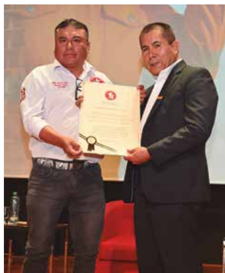
Durante la ceremonia, la FTCCP reconoció a sindicatos por la movilización para la presentación del Pliego 2026.

Se recordó los logros de la Federación en el marco de la negociación colectiva, como aumentos salariales y mejores condiciones laborales desde 1963; así como la mejora del acceso a la jubilación y la salud en el sector, y su lucha contra la extorsión y el sicariato, su defensa de la libertad y la